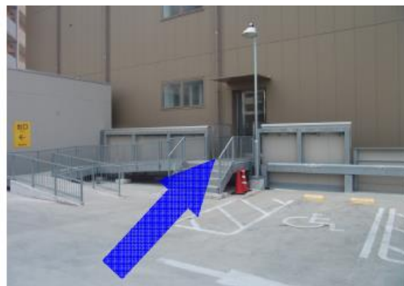
駐車場屋上入口よりお入り下さい